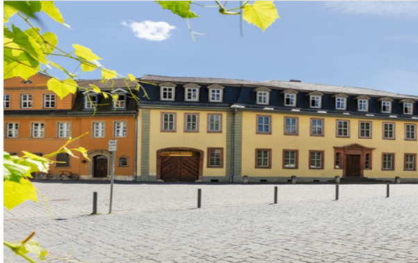
Maison de Goethe